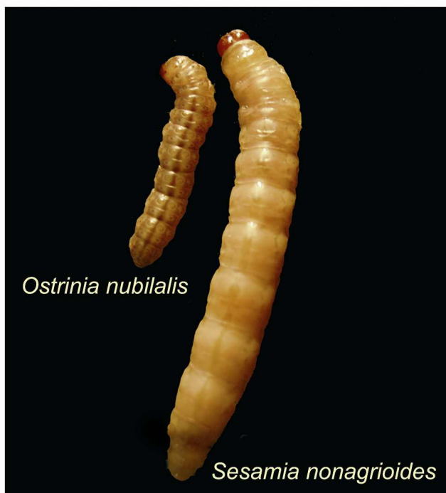
Foto 1. Larvas de taladro

Ostrinia nubilalis y Sesamia nonagrioides