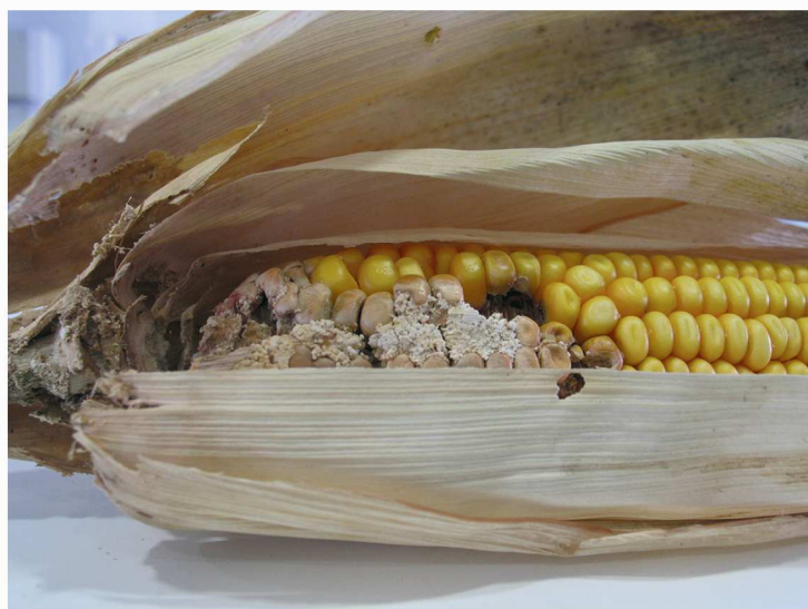
Foto 3. Daño en mazorca