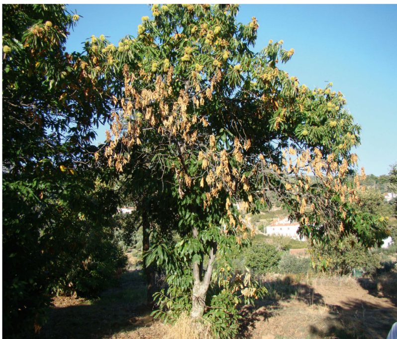
Foto 3. Aspecto de castaño afectado