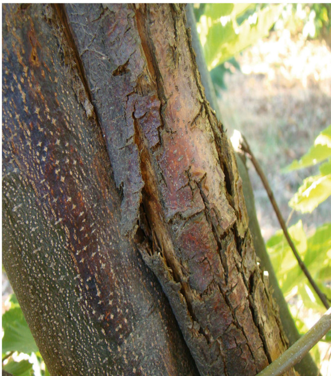
Foto 2. Chancro agrietamiento