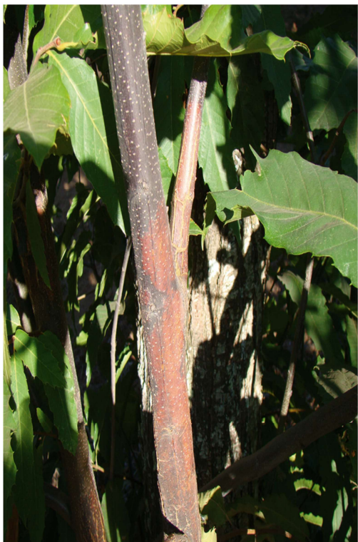
Foto 1. Inicio del Chancro. Depresión